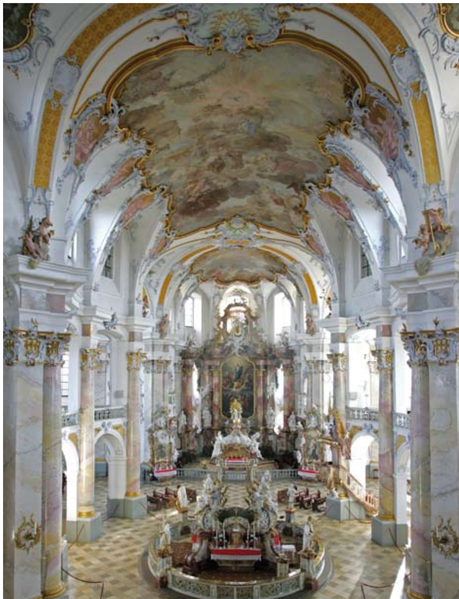
Die herrliche Basilika Vierzehnheiligen: Ziel unzähliger Pilger seit Jahrhunderten

strickungen unseres Lebens Vertrauen und Hoffnung auf das Gelingen unseres Weges schenkt“, schreibt der bekannte Benediktiner Pater Anselm