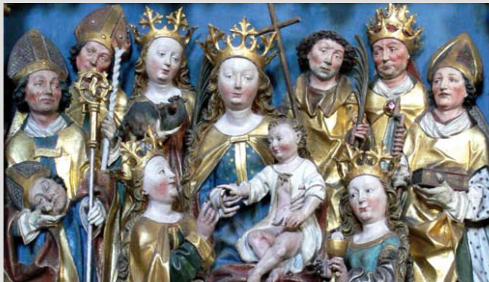
Darstellung im Heilbronner Münster: Maria, die Mutter Gottes, im Kreise der Nothelfer