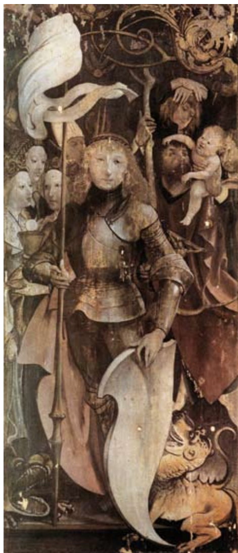
Darstellung der Nothelfer im Grünewald-Altar von Lindnerhard

Heiligen Barbara an, und zwar zugleich mit der Heiligen Katharina und der Heiligen Margareta. Im Volksmund entstand dazu der Spruch: „St. Margaretha mit dem Wurm, St. Barbara mit dem Turm, St. Katharina mit dem Radl, das