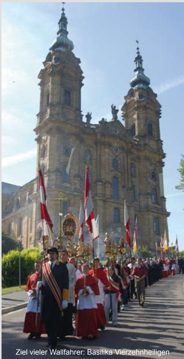
Ziel vieler Wallfahrer: Basilika Vierzehnheiligen

Vierzehnheiligen bei Staffelstein/Oberfranken ist die größte und bekannteste Wallfahrtsstätte zu den 14 Nothelfern.